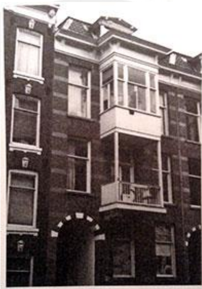
Geboortehuis van Bordewijk

We willen dit jaar onze Jaardag in Amsterdam houden. De stad waar Bordewijk is geboren en waarover hij veel heeft geschreven. Onze plannen beginnen al vorm te krijgen. De datum is nog niet bekend maar zal vallen in oktober 2018.