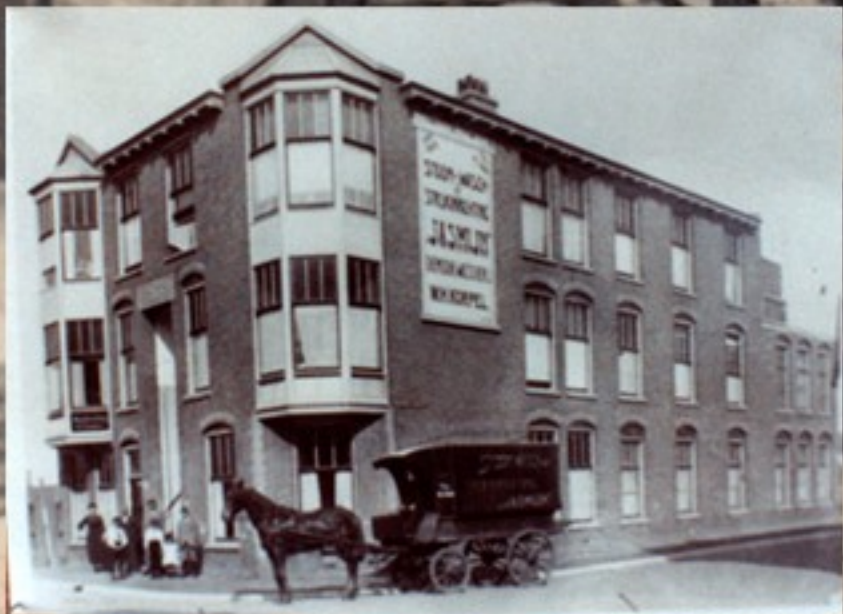
Pand van wasserij Jasmin in 1922 Jasminstraat 43 Den Haag